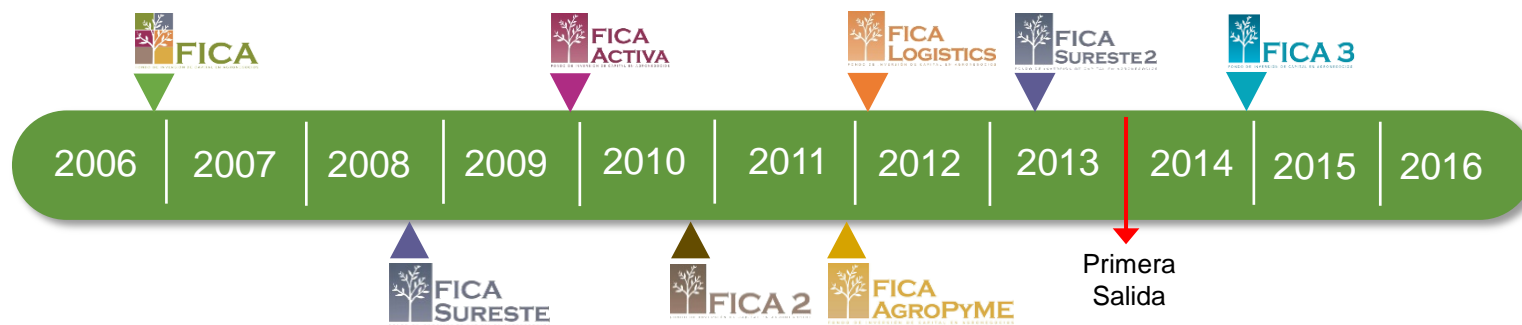
Ciclo de vida de los FICAS: